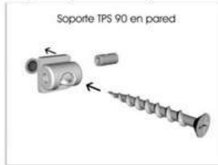
Ponemos los soportes y lo fijamos en la pared