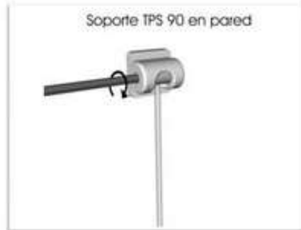
Apretamos con la llave allen