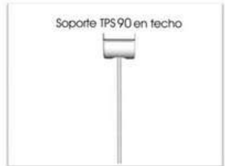
Así quedaría en el techo