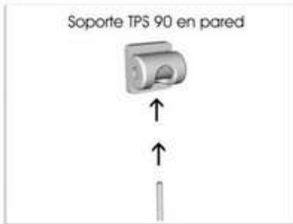
Introducimos el hilo / cable / varilla