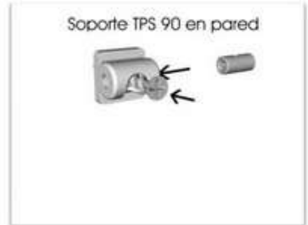
Introducimos el soporte-del hilo con el tornillo hacia el interior