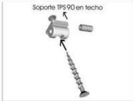
Ponemos los soportes y lo fijamos en el techo