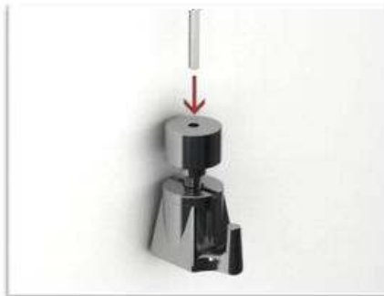
pasar el cable/nylon por el gancho