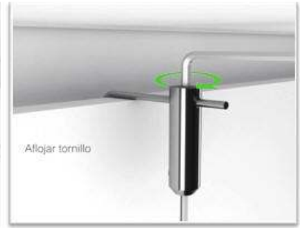
aflojar el freno (con 1/2 vuelta basta)