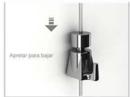
Apretar para bajar