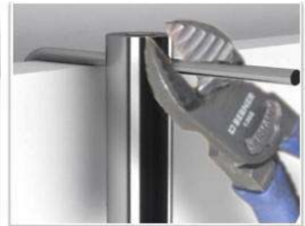
si lo considera necesario y va a estar en el mismo lugar u otro de igual grosor, PUEDE CORTAR el sobrante, Si lo va a usar en lugares diferentes NO LO CORTE