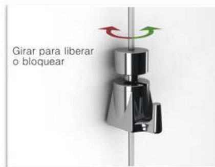
Girar para liberar o bloquear

En caso de necesidad o por seguridad puede Utd. bloquear o desbloquear el mecanismo girando la cabeza en un sentido u otro, no es necesario apretar fuertemente