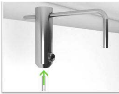
introducir el cable en el Soporte