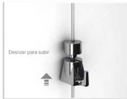
Deslizar para subir