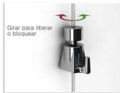
Girar para liberar o bloquear

En caso de necesidad o por seguridad puede Utd. bloquear el mecanismo girando la cabeza en un sentido u otro no es necesario apretar fuertemente