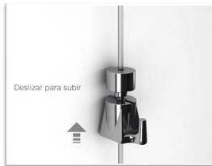
Desplazamiento hacia arriba