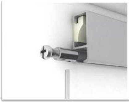
Montaje del colgador, introducir el nylon en el carril-guia